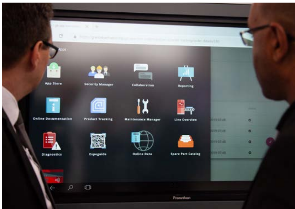
..... Übersicht über die Auswahlmöglichkeiten der SERICY-Plattform

Fazit: Die produktionsnahe Digitalisierung braucht ein Betriebssystem. IIoT-Plattformen bieten sich hier an. Marktforscher von Gartner gehen davon aus, dass bis Ende 2020 lokal installierte IIoT-Plattformen rund 60% der industriellen Analytik ausmachen werden – verglichen mit rund 10% in 2018. Hier zeigt sich noch ein weites Handlungsfeld. Zwar ist ein entsprechendes Ökosystem hier erst im Entstehen, doch der Trend ist eindeutig: plattformbasierte Applikationen werden auch im industriellen Umfeld zum entscheidenden Differenzierungsfaktor.